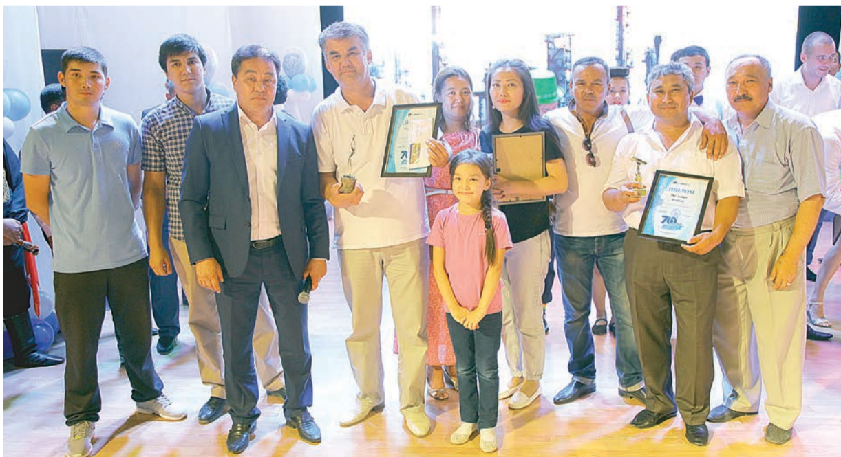
Номинация «Сила в единстве» - ППНГО