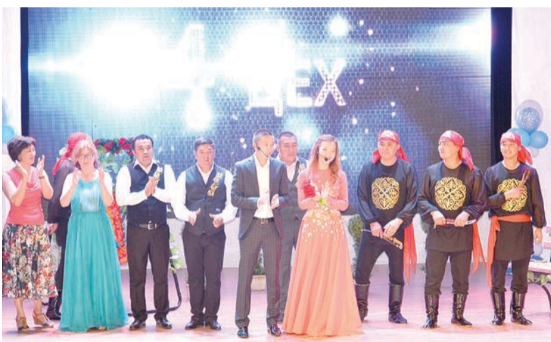
Номинация «Прорыв вечера» - цех № 4